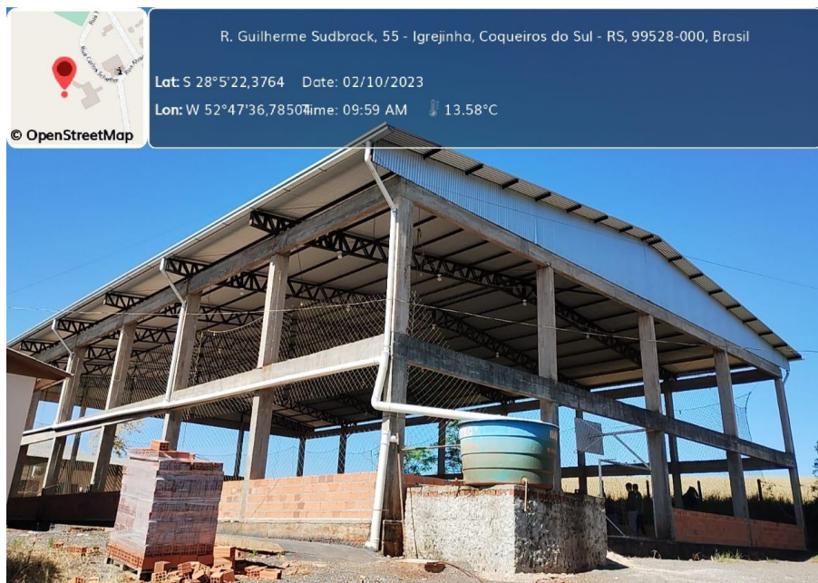
Figura 2: Estrutura da quadra da escola