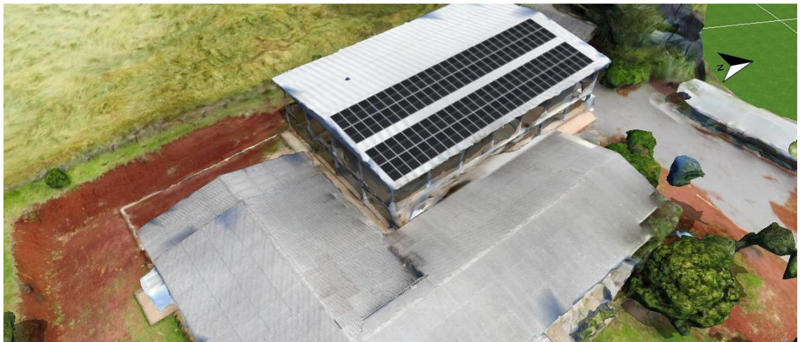
Figura 1: Esquema da montagem das placas sobre a cobertura

O Município de Coqueiros do Sul possui projeto de instalação de sistemas de energia solar em alguns prédios de sua propriedade.